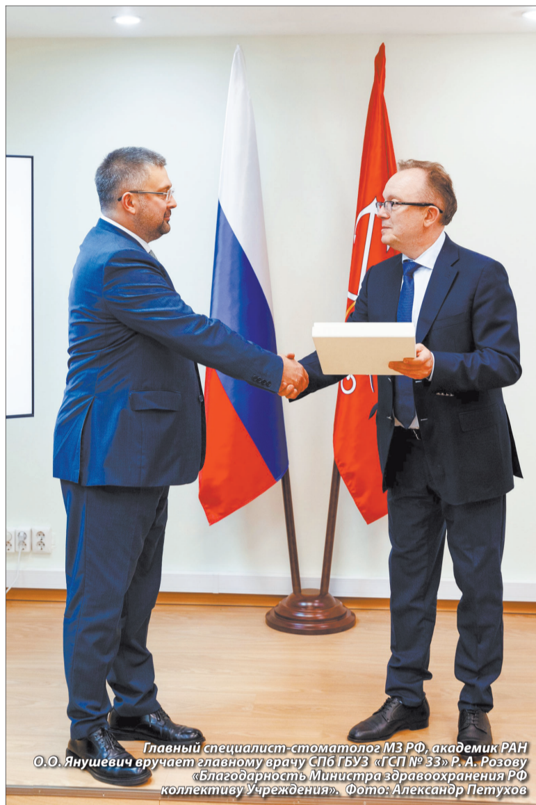
Главный специалист-стоматолог МЗ РФ, академик РАН О.О. Янушевич вручает главному врачу СПб ГБУЗ «ГСП № 33» Р.А. Розову «Благодарность Министра здравоохранения РФ коллективу Учреждения».

В юбилейный день работников учреждения поздравил Главный специалист-стоматолог Минздрава России, Ректор ФГБОУ ВО «Российский университет медицины» Минздрава России, Заслуженный врач РФ, академик РАН, профессор Олег Олегович Янушевич. От имени министра здравоохранения РФ М.А. Мурашко он вручил благодарность коллективу и некоторым врачам, а также вручил знаки «Отличник здравоохранения».