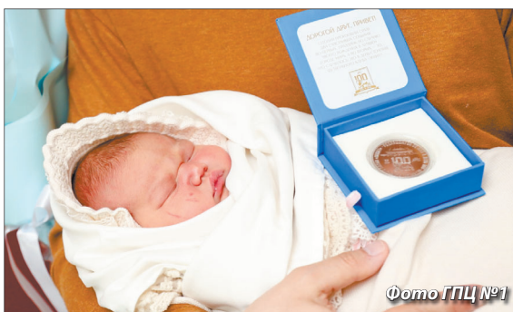
Фото ГПЦ №