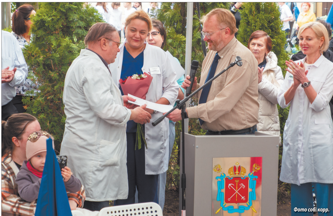
Фото соб. корр

Благодаря таким праздникам и поддержке первых лиц города наши подопечные быстрее идут на поправку, выздоравливают и радуют родителей хорошим самочувствием и улыбками.