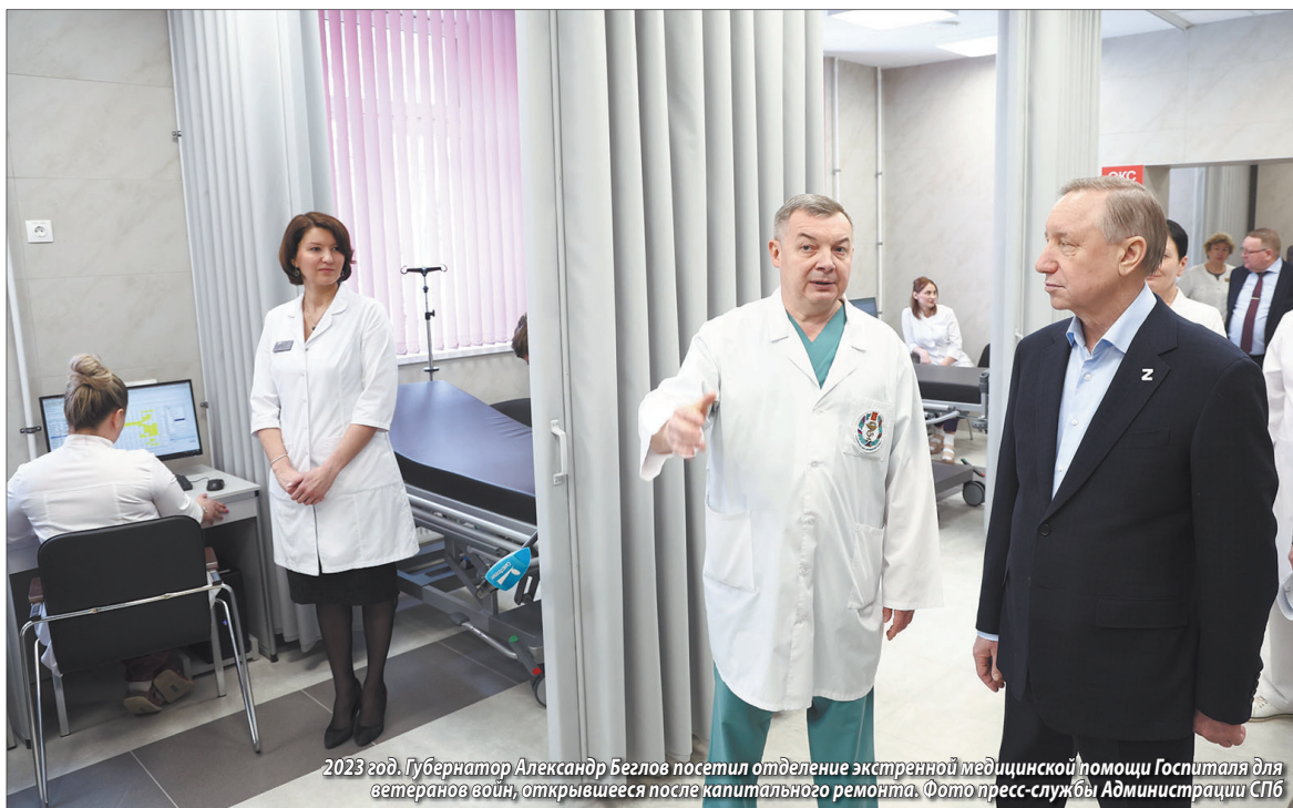
2023 год. Губернатор Александр Беглов посетил отделение экстренной медицинской помощи Госпиталя для ветеранов войн, открывшееся после капитального ремонта.