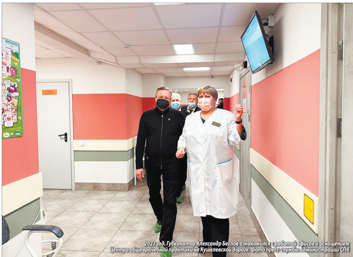
2023 год. Губернатор Александр Беглов ознакомился с работой офисов и оснащением Центра общеврачебной практики на Кушелевской дороге.